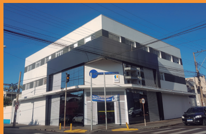
Laboratório Sepac inaugura nova unidade de atendimento, Rua São Paulo 710.