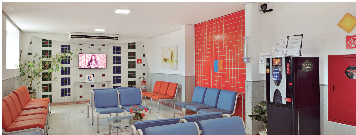
RECEPÇÃO CENTRO CLÍNICO

OPERADORA CONTA COM TELEMEDICINA E MEDICINA PREVENTIVA GRATUITA AOS BENEFICIÁRIOS