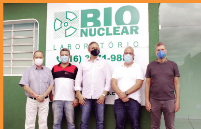
Bionuclear - Diretoria da Santa Casa Saúde prestigia inauguração da Unidade Bionuclear na Avenida Saúde, 356