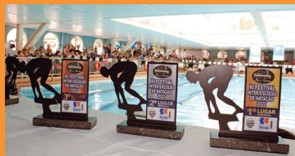
Santa Casa Saúde patrocina campeonato de natação Swimming Center Recra