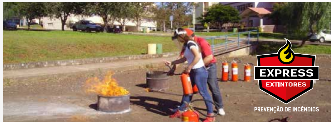
5 - Ruído