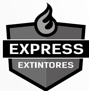
2 - Preto e Branco