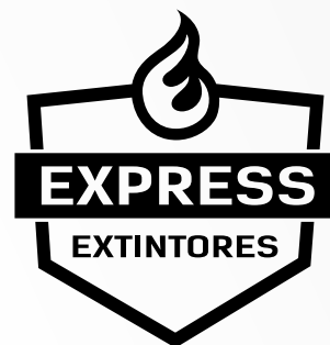
3 - Positivo