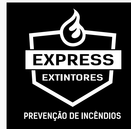
4 - Negativo